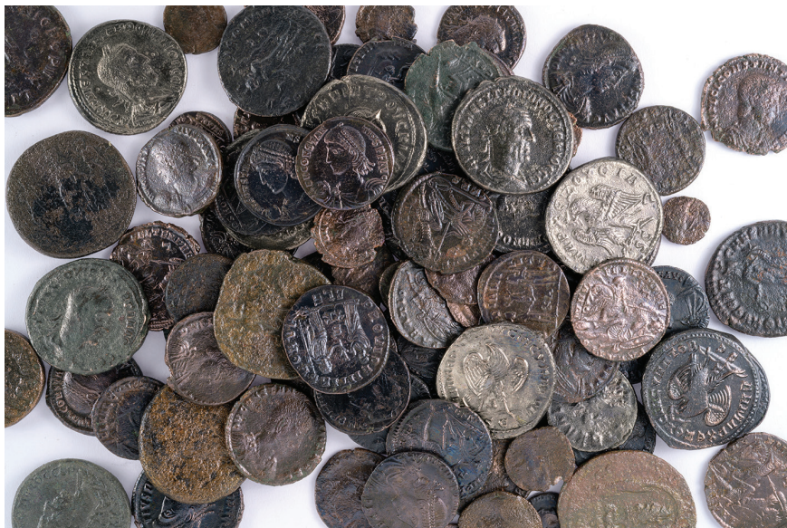
איור 5: מטמון המטבעות

טבלה 1: טבלת פירוט למטמון מיחידה 1.6 (הפקה: ש' קריספין, רשות העתיקות)