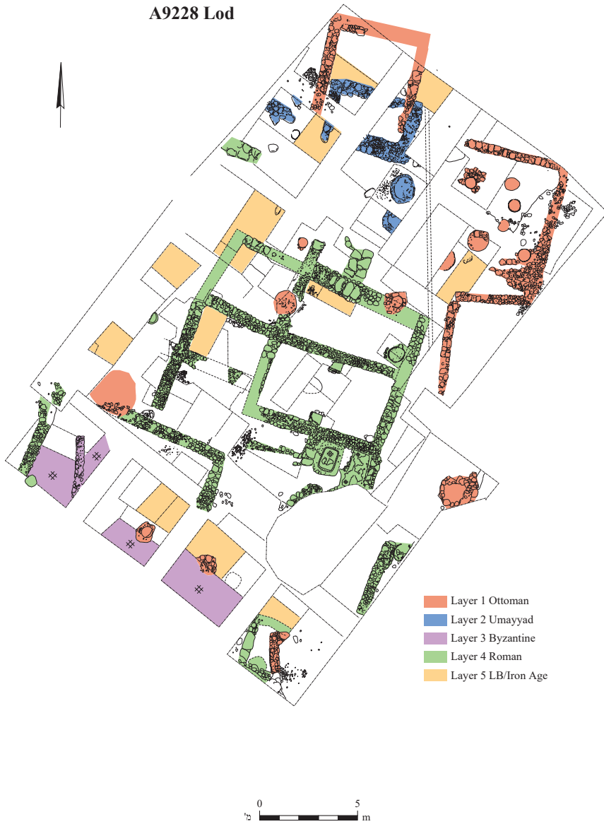
איור 2: תוכנית כלל השכבות (שרטוט: י' גומני, רשות העתיקות)