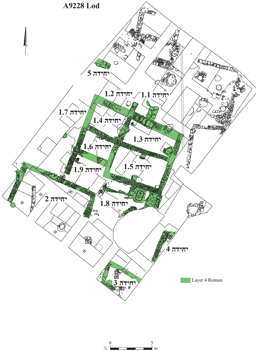
איור 3: תוכנית יחידות אדריכליות משכבה 3 (שרטוט: י' גומני, רשות העתיקות)