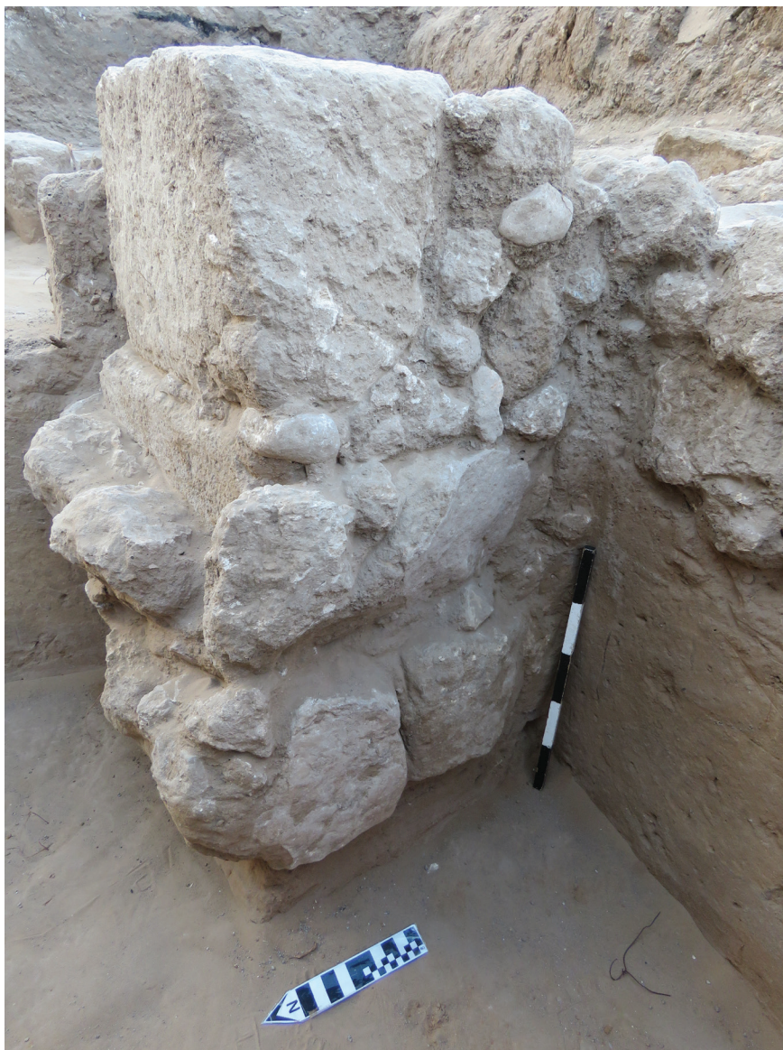
איור 4: האומנה הדרומית ביחידה 1.5, מבט לדרום-מזרח