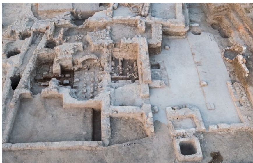
איור 5: בית המרחץ במרכז שטח החפירה