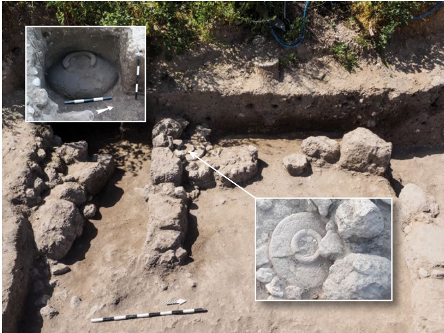
איור 8: טבון ואבן שחיקה במבנה מהתקופה הממלוכית

הישובים לאורך התקופות – כפי שמשקף מחפירות סביב התלים, כדוגמת החפירה בתל קטרה – משקפים שינויים באופי הכלכלי והחברתי של הישוב ושל תושביו (איילון 1997; דבורצ'צקי 2001; 2001–2002; פישר וטקסל 2008; טקסל 2013).