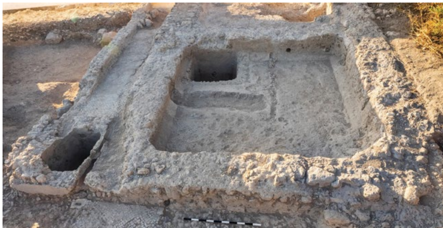
איור 6: מתקן מרוצף פסיפס במתחם הבאר