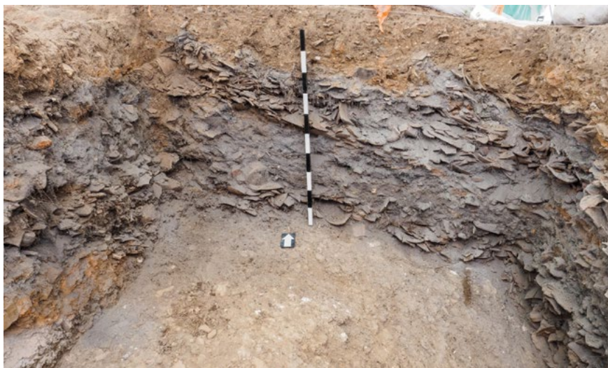
איור 4: ערמת פסולת כבשן יוצרים