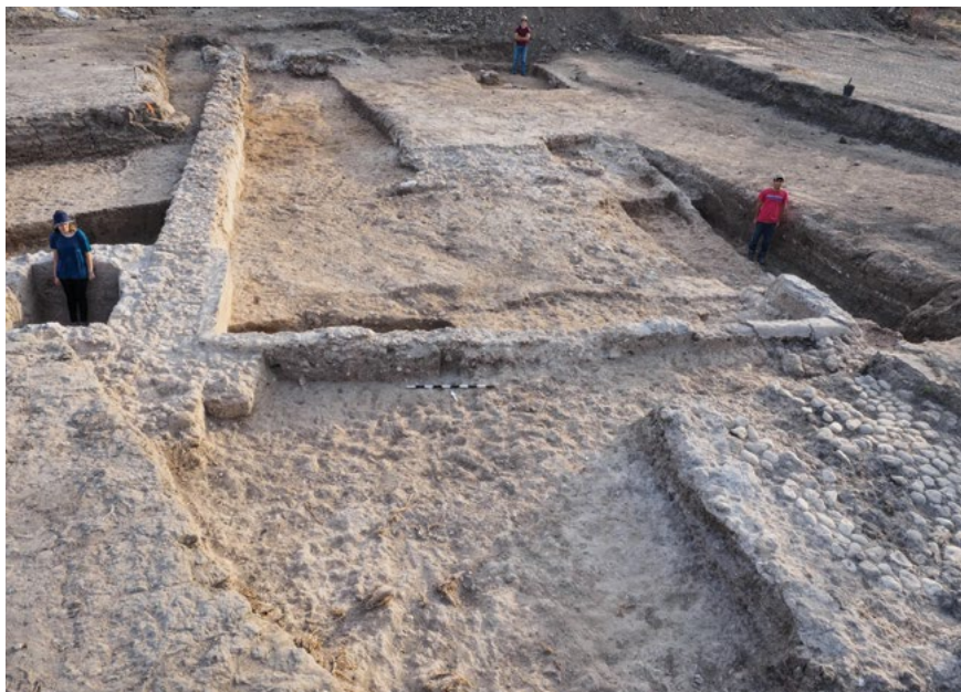
איור 7: ברכות כפולות ומתקן מרוצף חלוקי נחל