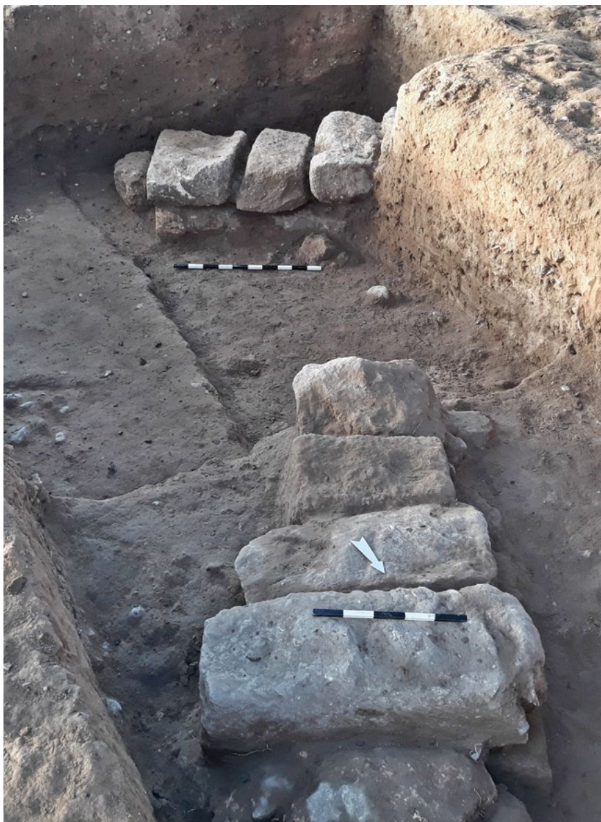
איור 3: קברי ארגז