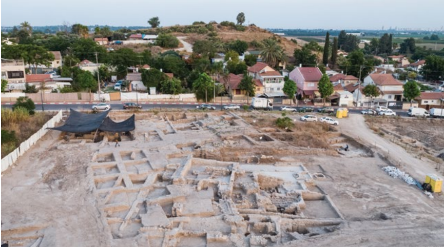
איור 1: מבט כללי לתל קטרה

בגדלים שונים ובתצורות שונות. יחד עם זאת סימון הריבועים בכל שטחי החפירה נעשה ברשת אחידה (איור 2).