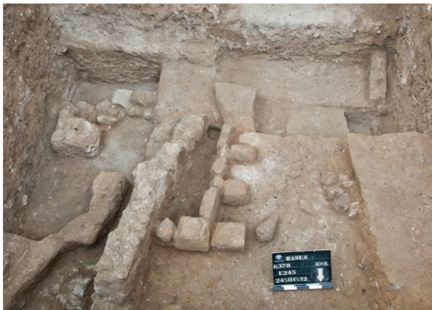
איור 2: המטבח – מבט למערב

מן הים האדום ועצם מגולפת נתגלו אף הם בחדר. למרגלות קיר בחדר הצפוני נתגלה קנקן ולו ארבע ידיות. הקנקן היה מרוסק מכובד שפוכת שנפלה מעליו (איור 3). בקרבה מידית לקנקן זה נתגלו אסוך לשמן עשוי ברונזה (איור 4); סיכת רכיסה ששימשה גם כבית קמע (איור 5), אף היא עשויה מברונזה, ופסלון אושבתי (איור 5). נראה ששלושת הפריטים הללו הוצגו לראווה על מדף שהיה ממוקם מעל לקנקן.