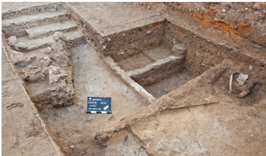
איור 3א: חדרי האירוח – מבט לדרום