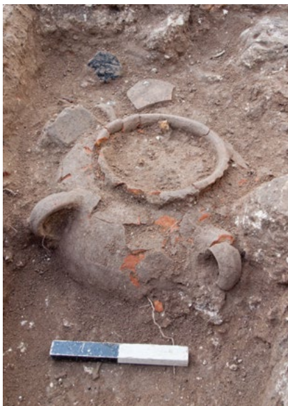
איור 3ב: הקנקן שלצדו נמצא הפסלון – מבט לדרום