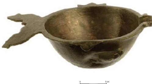
איור 4א: אסוך לשמן