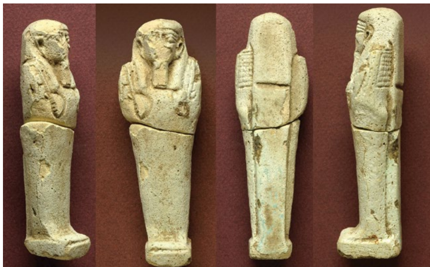
איור 5: פסלון האושבתי